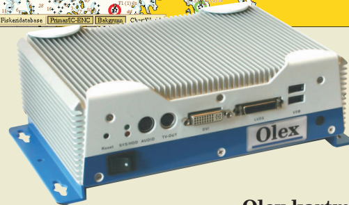
Olex kartmaskin M1